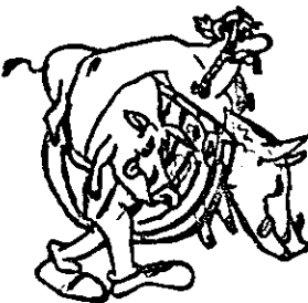
Guarder Gaulois et Emblème luxembourgeois (d'après Breughel l'Ancien)