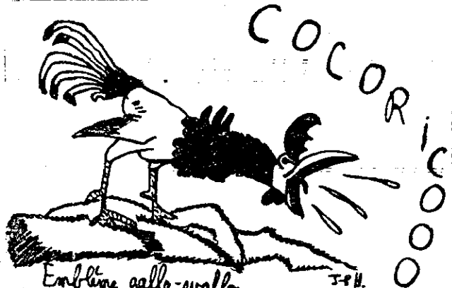
Emblème gallo-wallon au travail "Le xavil" d'après Breughel l'Ancien